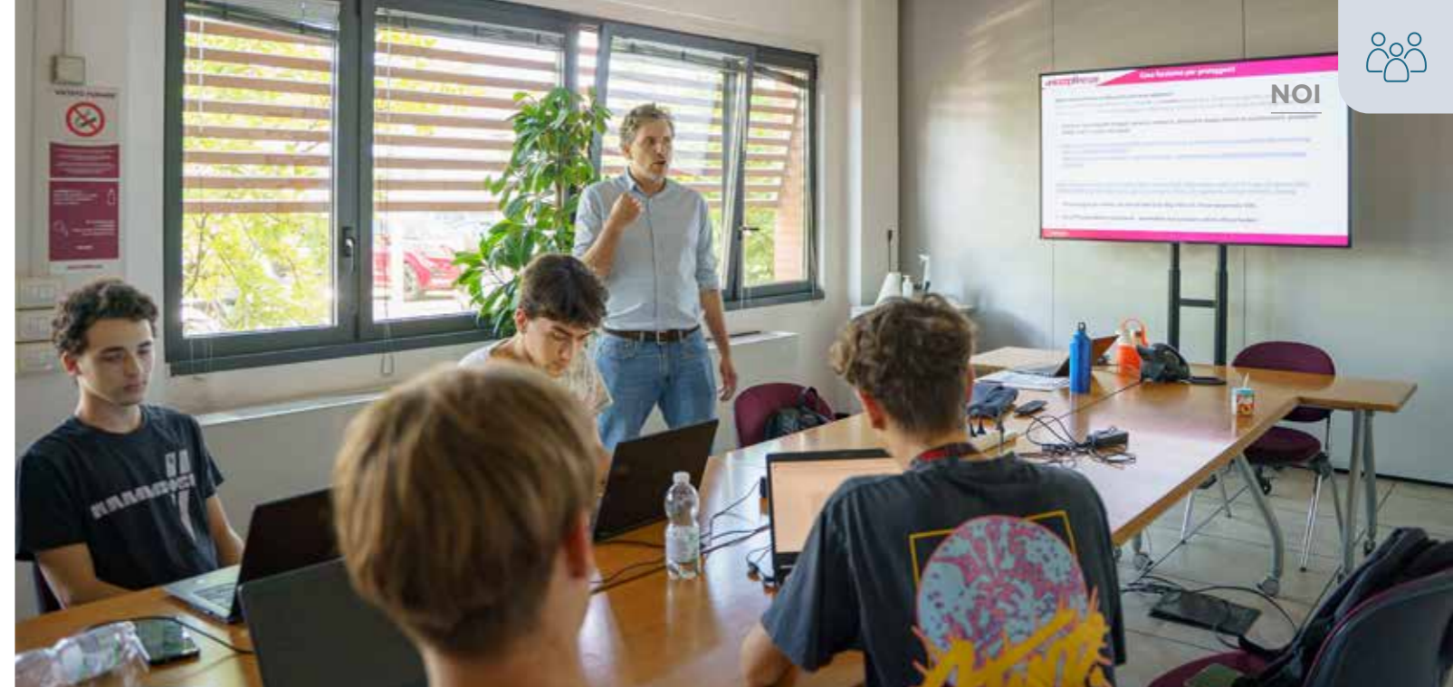
Nelle foto alcuni dei momenti trascorsi insieme ai ragazzi e alle ragazze delle scuole superiori.