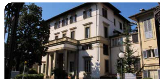
Casa di Cura Villa Donatello.