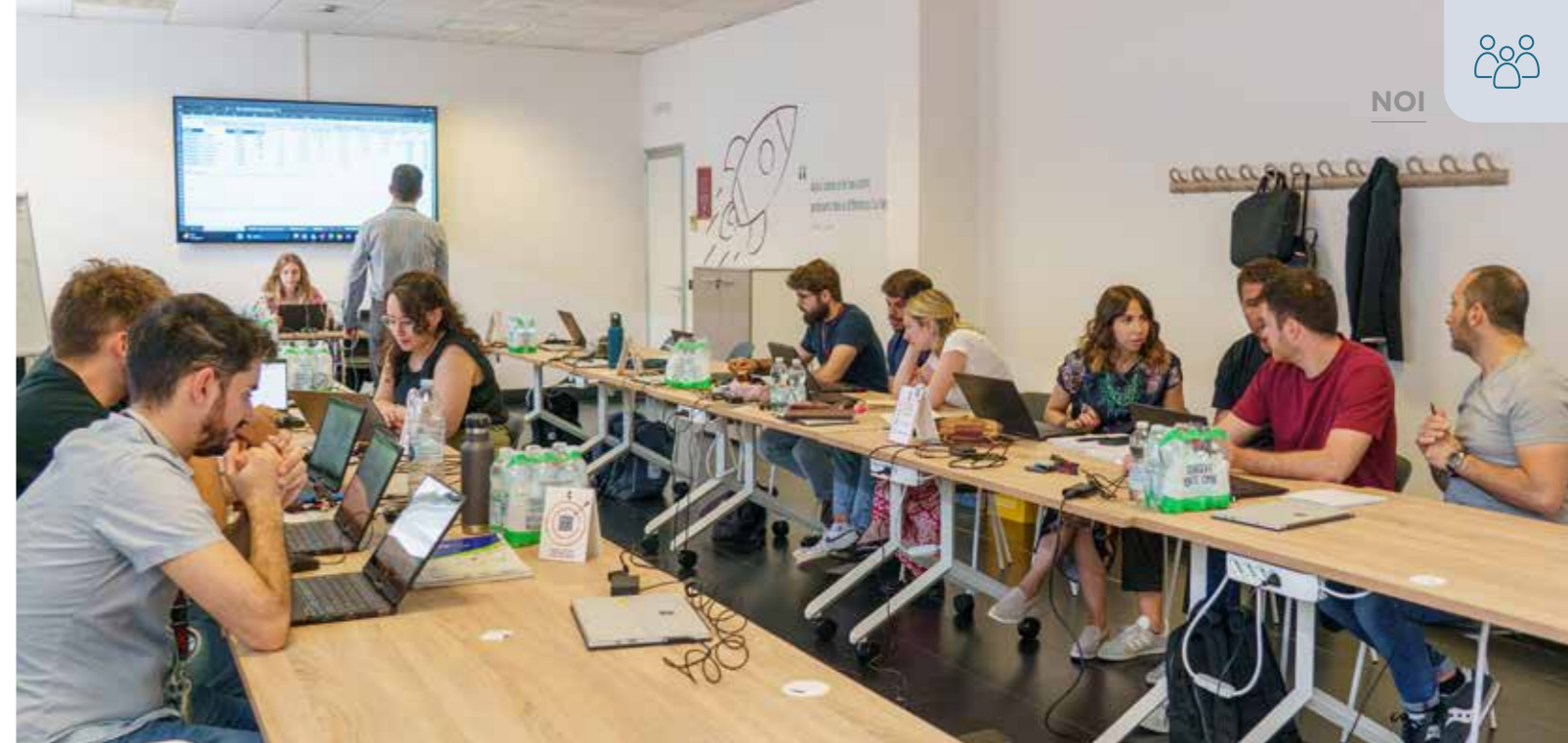
Nella foto un momento dell'attività in aula di formazione.

Non ultimo, l'obiettivo della Summer school, come di tutto il percorso, è quello di dare l'opportunità ai colleghi di vivere un'esperienza comune .