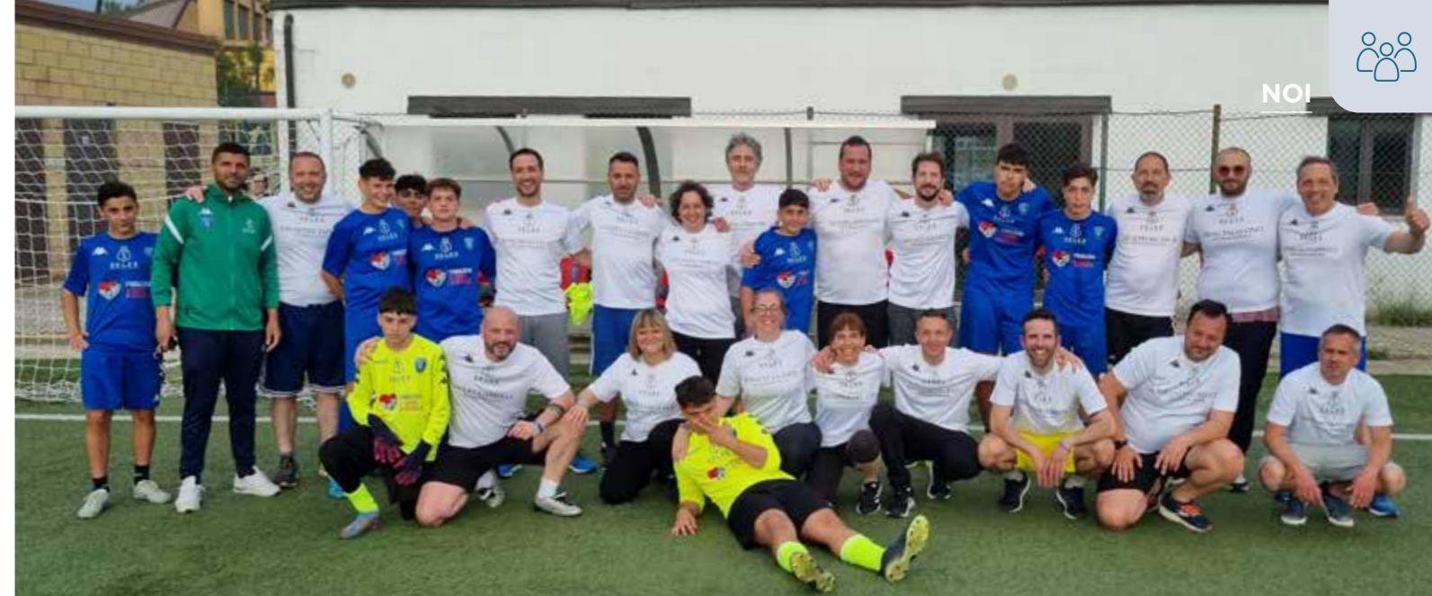
I colleghi di Unicoop Firenze e Terre di Mezzo insieme ai ragazzi della SELES.

È stata certamente un'esperienza formativa per tutte le persone che vi hanno preso parte (20 Direttori di punto vendita di recente nomina e alcune/i colleghe/i della Direzione Merci e Direzione Persone) un viaggio di apprendimento e consapevolezza in una bellissima terra, la Calabria, fatta di uomini e donne che resistono caparbiamente alla cultura mafiosa della prepotenza e della sopraffazione.