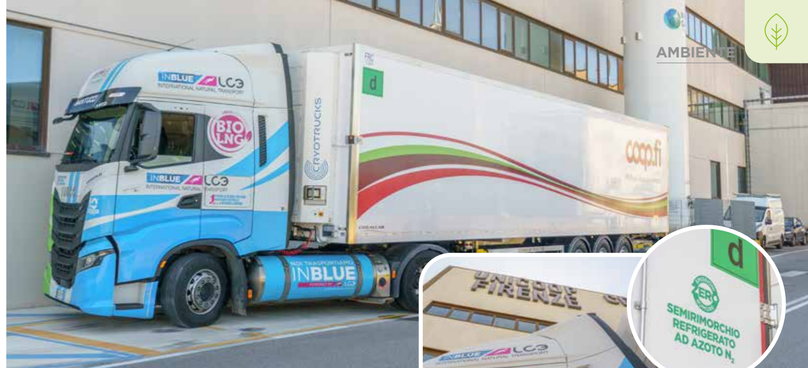
Il nuovo camion refrigerato ad azoto.