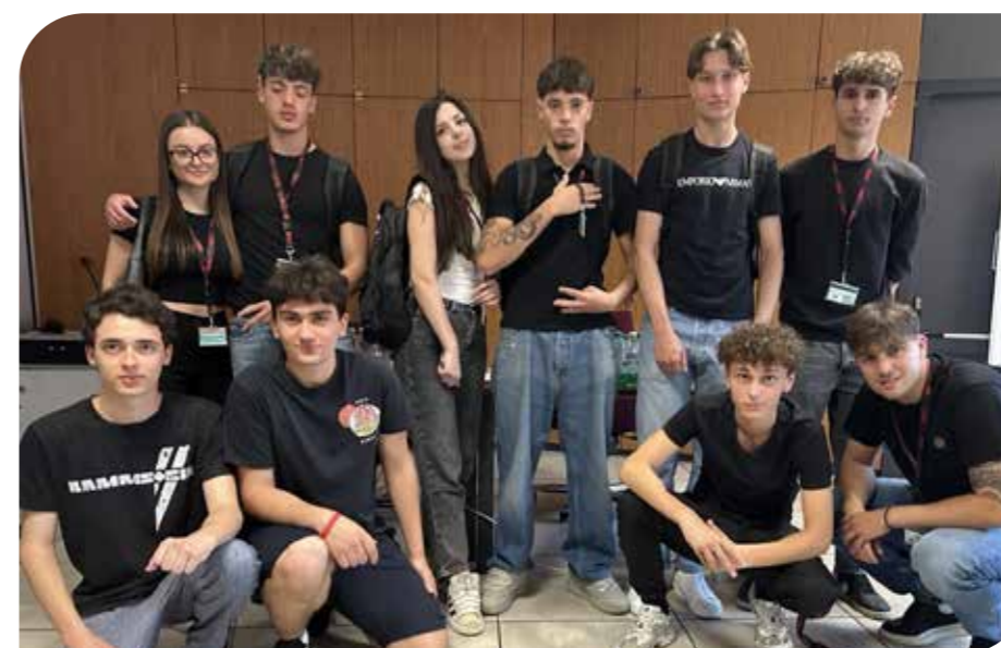
I ragazzi che hanno partecipato al PCTO.