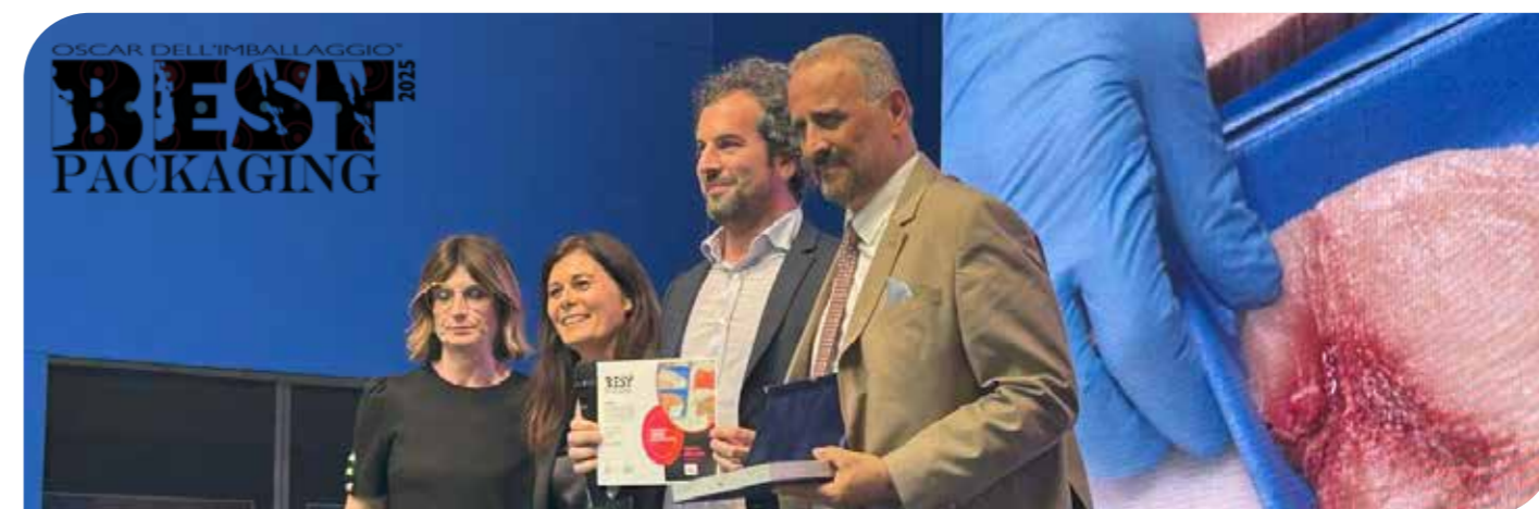
Alcuni momenti della cerimonia di premiazione.