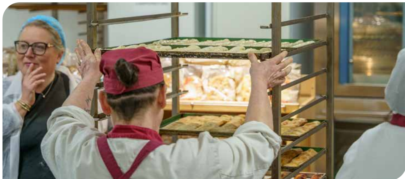
Nelle foto alcuni momenti dei laboratori di Cerealia.

Per la formazione mestiere rimane centrale il ruolo del punto vendita, accanto al quale stiamo introducendo, in ottica evolutiva, nuove modalità di apprendimento che includono