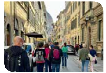
Via dei Servi.

Proseguendo, da Via dei Servi , Piazza di San Pier Maggiore , Via dell'Oriuolo , tappa dopo tappa è stata ricostruita la storia di monache e potenti badesse, insieme a quella delle nobildonne e delle serve, con un percorso simbolico fra le strade del vizio e del pentimento.