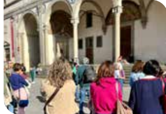
Spedale Degli Innocenti.

orientale e co-patrona di Firenze, e lo Spedale degli Innocenti , in Piazza Santissima Annunziata, che racchiude le storie di vita quotidiana delle fanciulle, entrate nell'istituto neonate e lì cresciute tra lavoro e devozione.