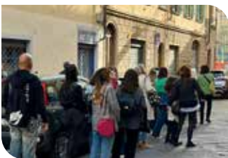
Via Santa Reparata.

Da Piazza della Libertà a Piazza Santa Croce, l'itinerario ha toccato tante tappe al femminile: tra queste, Via Santa Reparata , martire