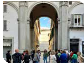
Piazza San Pier Maggiore.