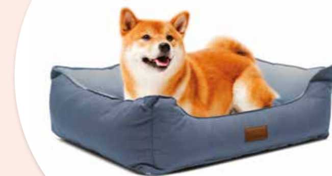
Cuccia pet Caleffi