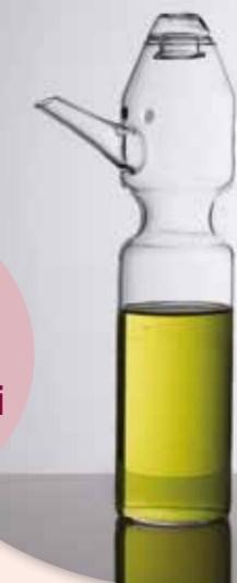
Oliera Pinolio IVV