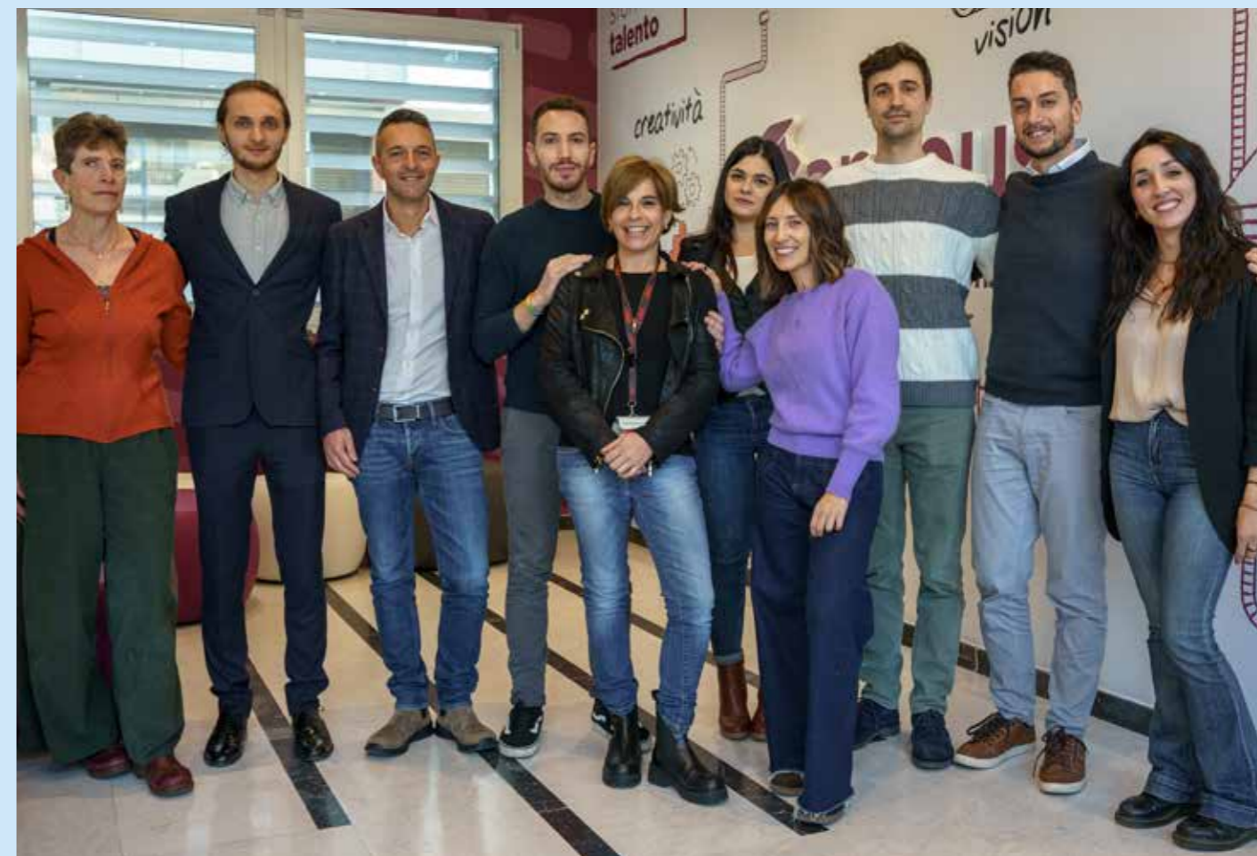
I colleghi dell'Ufficio Formazione.

Scopriamo il nostro Campus con i colleghi dell'Ufficio Formazione.