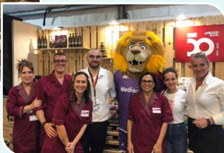
Fiera di Scandicci.