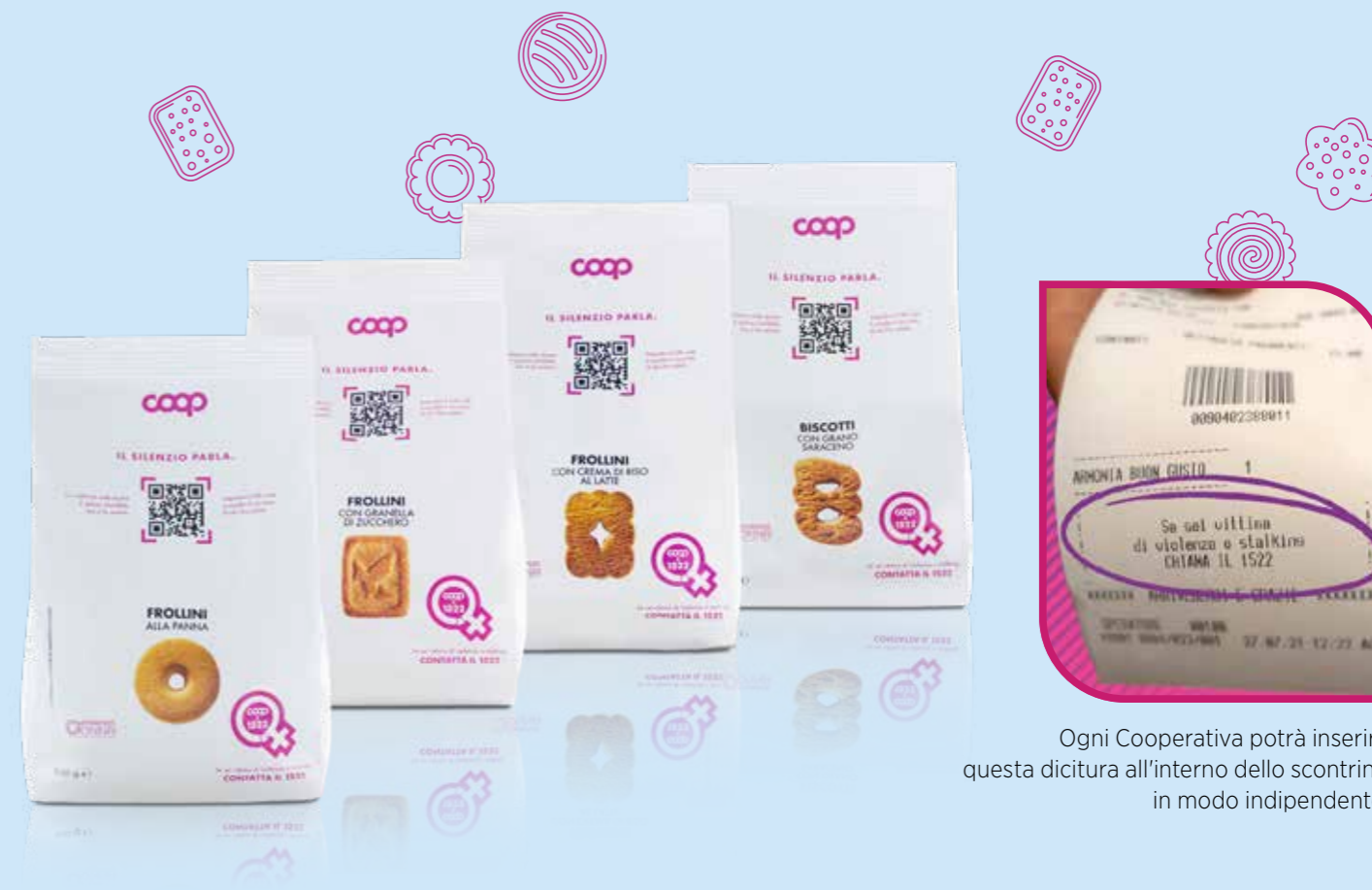
Ogni Cooperativa potrà inserire questa dicitura all'interno dello scontrino in modo indipendente.

La Cooperativa da sempre si impegna a tutelare la dignità delle lavoratrici e dei lavoratori e a prevenire qualsiasi fenomeno di molestia, fisica o psicologica.