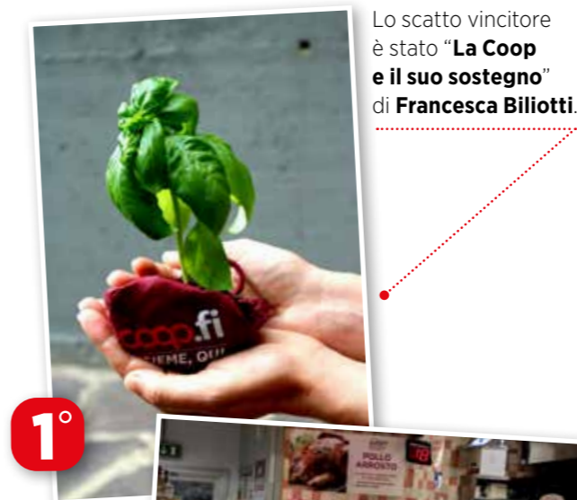
Lo scatto vincitore è stato "La Coop e il suo sostegno" di Francesca Biliotti .

A loro il compito di premiare i colleghi finalisti.