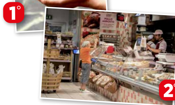
Seconda classificata, la foto "Quotidianità", scattata dalla collega Adriana Ferri .