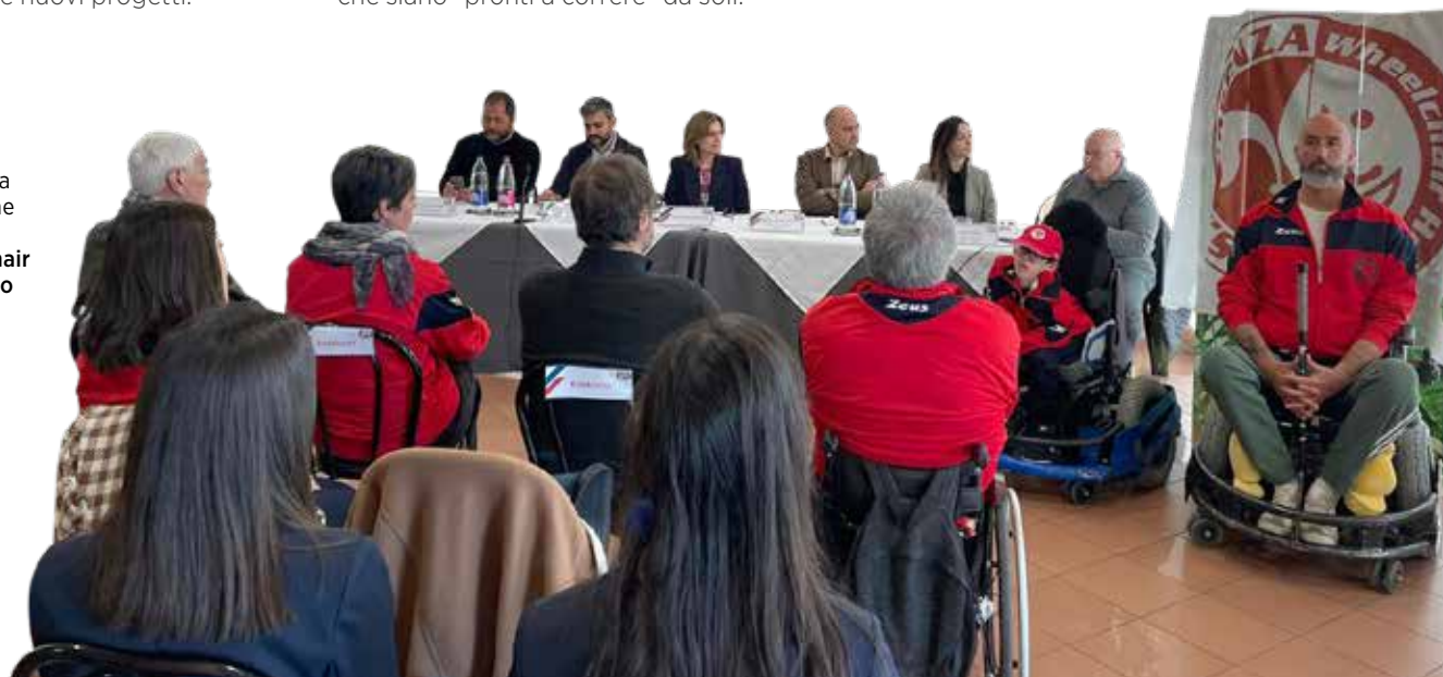
Foto tratta dalla conferenza stampa della presentazione dell'iniziativa Firenze Wheelchair Hockey - Vinciamo insieme.

Compagnia Teatrale Bucchero APS di Bettolle. La tua donazione favorirà l'attività di teatro sociale sul territorio, promuovendo l'inclusione e l'abbattimento delle barriere sociali.