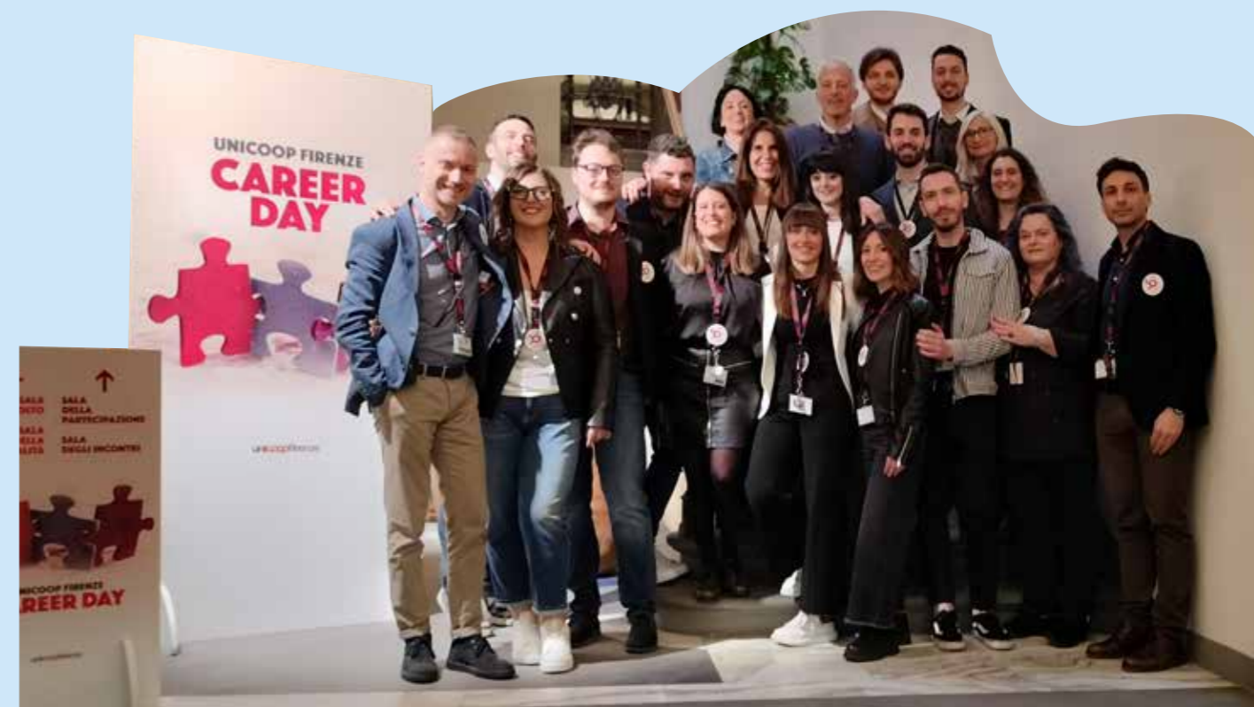
Nella foto i colleghi che hanno partecipato al Career Day.

In poche parole... oltre le aspettative!