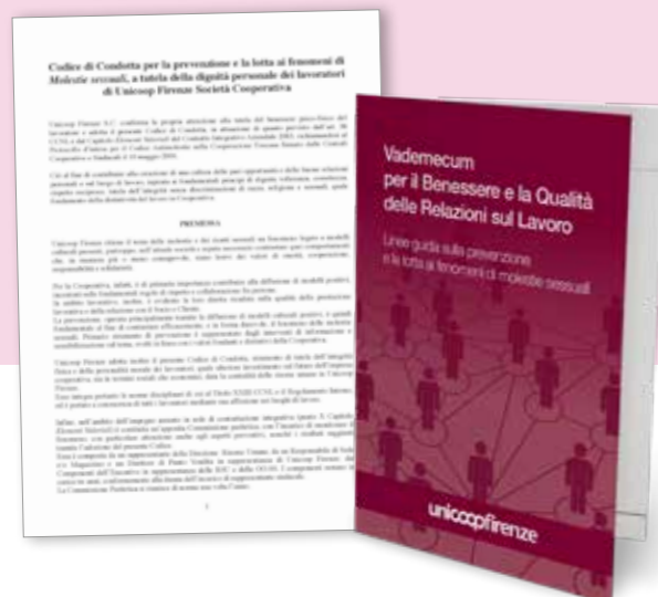
A sinistra il Codice di condotta per la prevenzione e la lotta ai fenomeni di molestie sessuali e il Vademecum di Unicoop Firenze.

Questa figura è raggiungibile al seguente indirizzo: consiglierafiducia@unicoopfirenze.coop.it