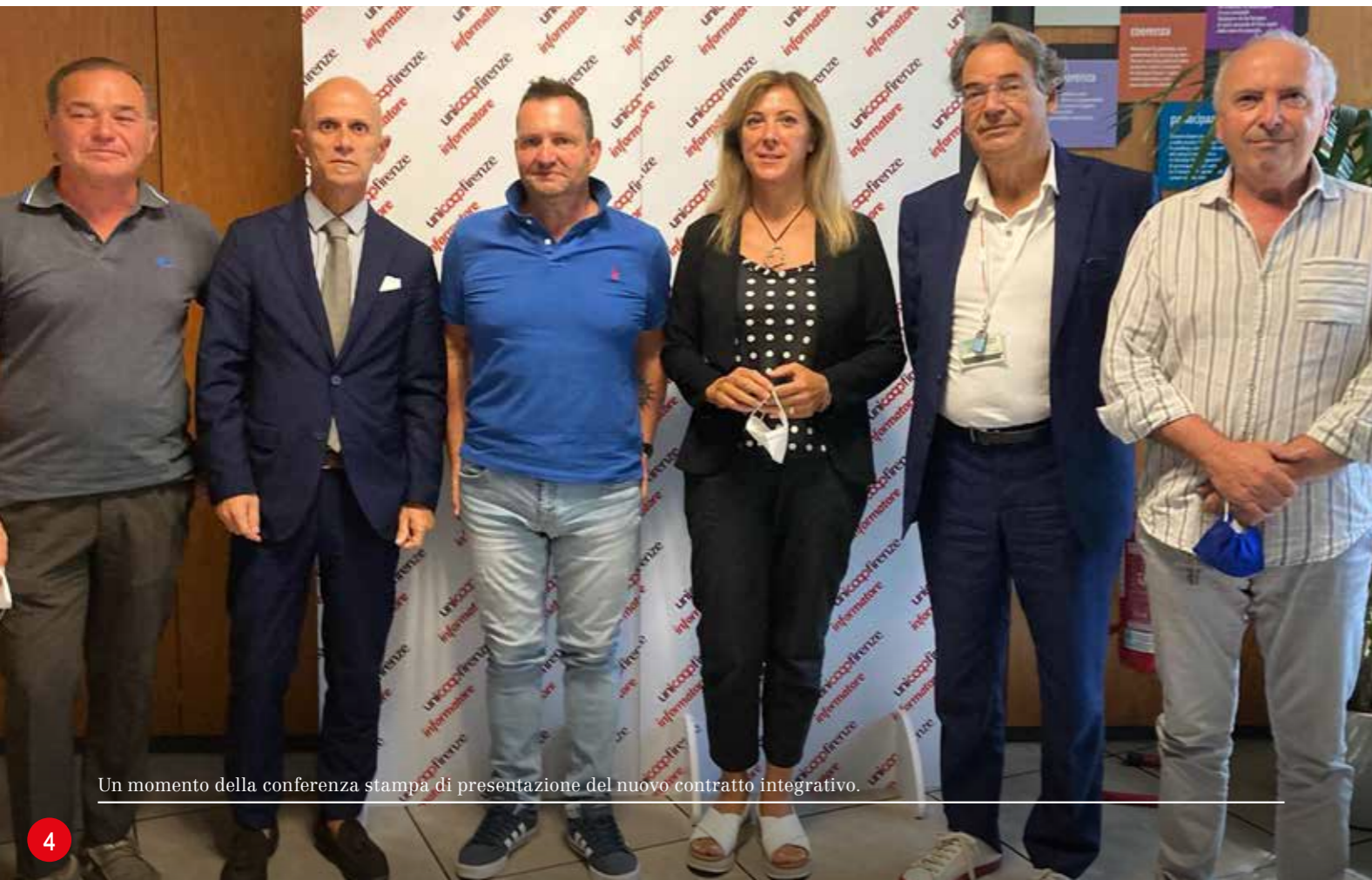
Un momento della conferenza stampa di presentazione del nuovo contratto integrativo.