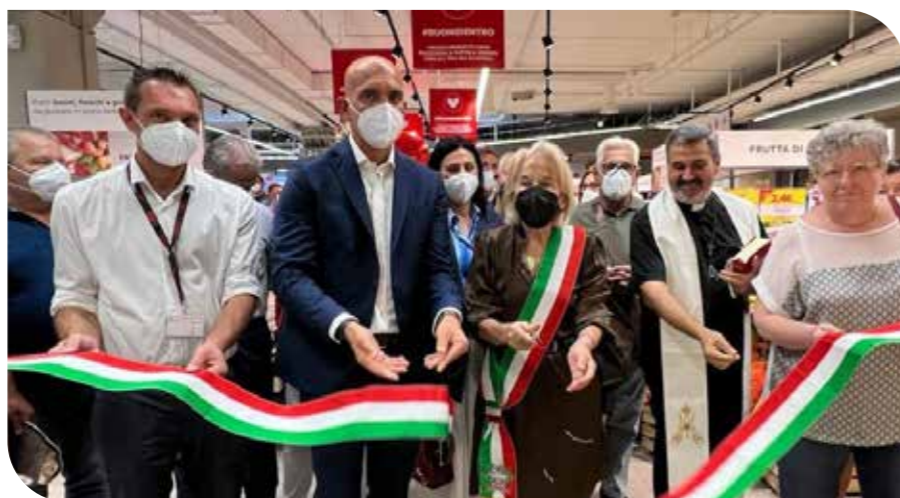
L'inaugurazione di Pisa San Giusto.

Per la Cooperativa, i diversi formati di negozio (minimercati, supermercati e superstore) sono un grande punto di forza sul territorio, perché soddisfano con le proprie proposte gran parte delle esigenze di Soci e clienti. Se finora la dimensione del punto vendita è stata il principale indicatore nel formulare la proposta di assortimenti e servizi, oggi , grazie a un ascolto attento delle esigenze di Soci e consumatori, abbiamo compreso che la dimensione non può più essere il solo elemento di differenziazione dei nostri negozi.