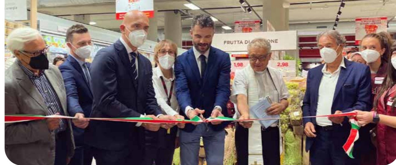
L'inaugurazione di Prato Via Roma.

Questi indicatori ci hanno permesso di vedere se i nostri Soci e clienti utilizzano i punti vendita come Negozio di Riferimento per