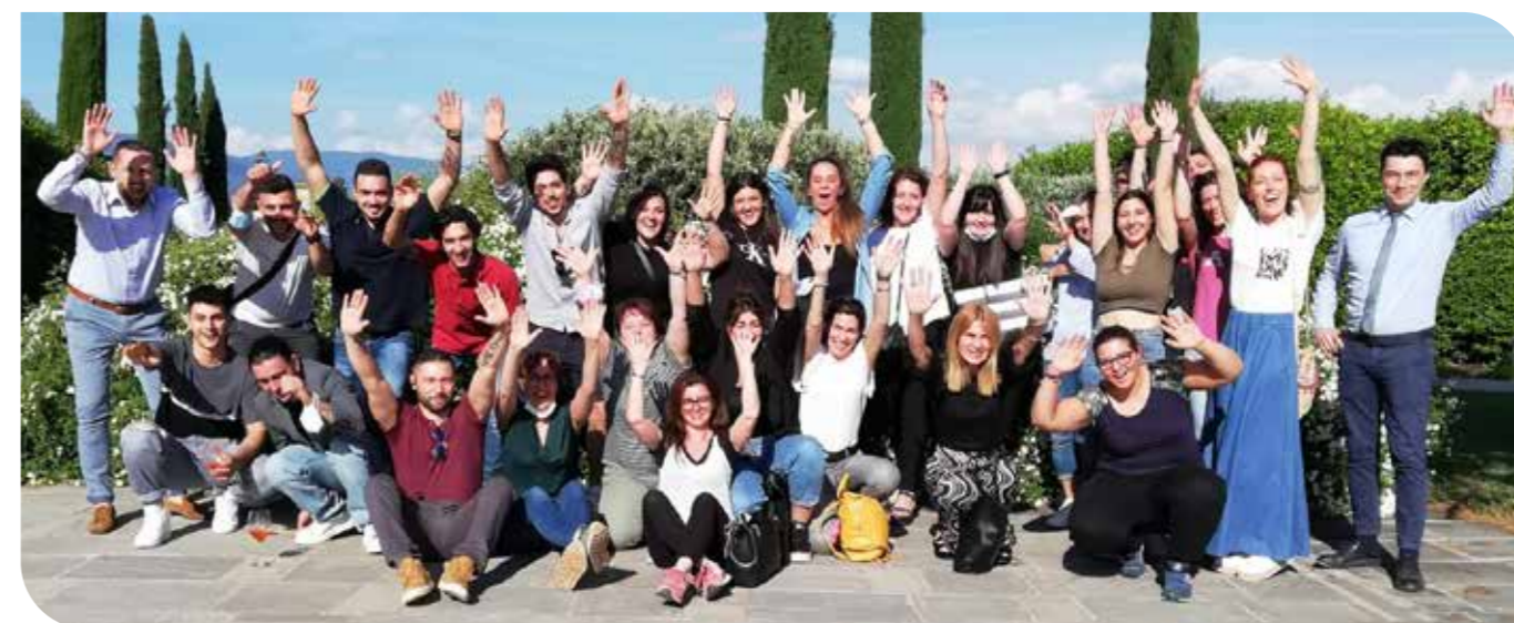
I colleghi di Prato Via Roma durante l'incontro di presentazione del punto vendita.

la voce diretta dei dipendenti, le novità a tutta la Cooperativa, hanno preso parte ad attività di ascolto per raccogliere le loro impressioni e ricavare utili suggerimenti per la realizzazione dei progetti.