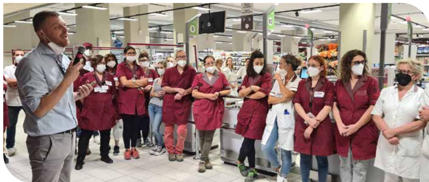
I colleghi di Arezzo Via Vittorio Veneto durante un incontro il giorno prima dell'apertura.

Nella progettazione del nuovo punto vendita è stato dato ampio spazio al servizio e alle referenze locali. Per quanto riguarda l'ortofrutta , per potenziare un miglior servizio al cliente, è stata prevista un'assistenza alle vendite da parte degli addetti, presenti direttamente in reparto in determinate fasce orarie, che si possono riconoscere grazie a una pettorina indossata che invita a chiedere assistenza.