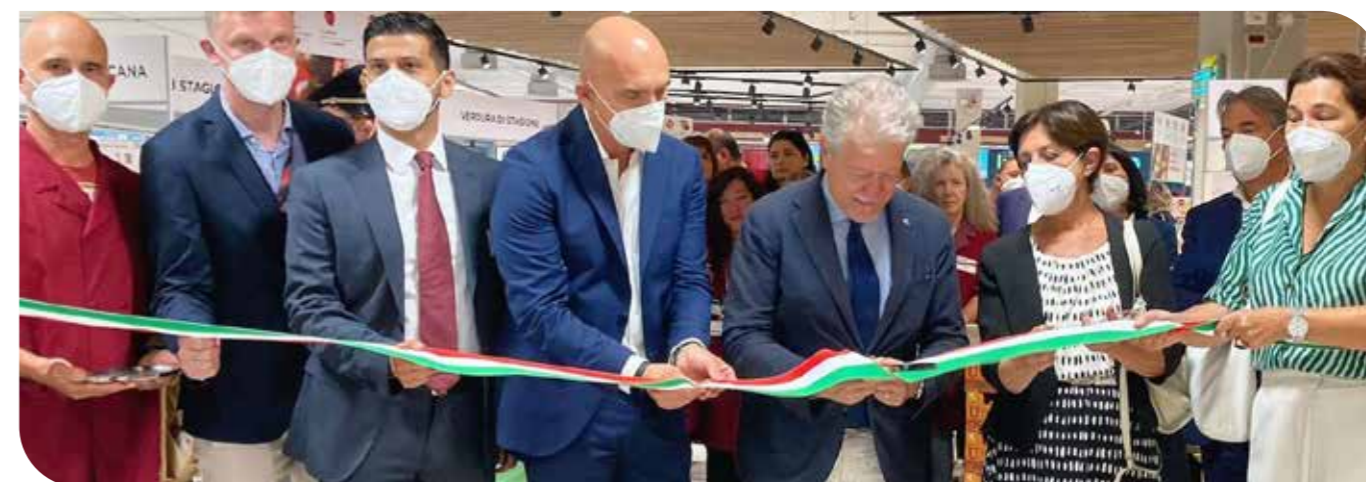
L'inaugurazione di Arezzo Via Vittorio Veneto.

Arezzo Via Vittorio Veneto si presenta, dopo la ristrutturazione, come un supermercato di riferimento per il quartiere. >>>