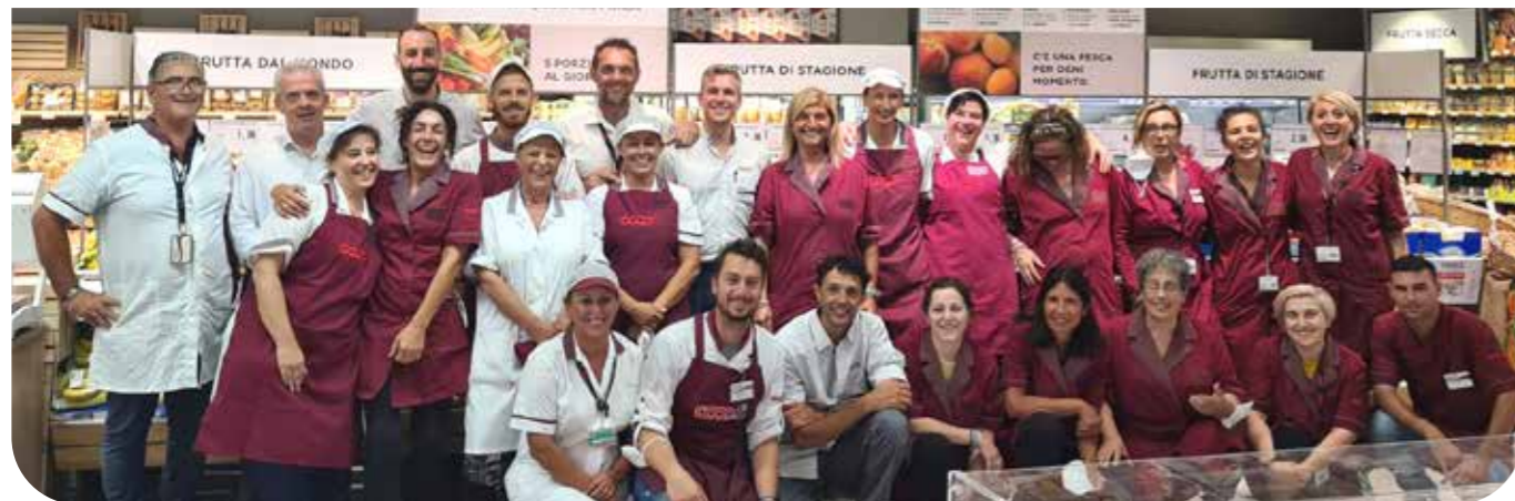
I colleghi di Pisa San Giusto.