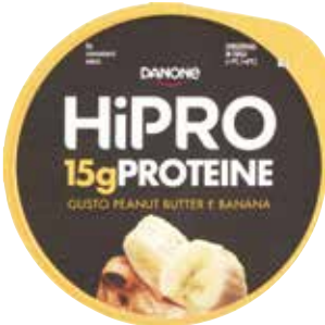
HIPRO DANONE 160 g - burro di arachidi e banana, mirtilli, vaniglia