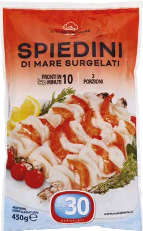
SPIEDINI DI MARE MENO30 450 g