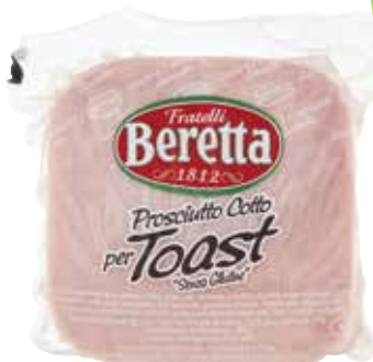
PROSCIUTTO COTTO PER TOAST FRATELLI BERETTA 400 g