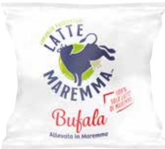
MOZZARELLA DI LATTE DI BUFALA LATTE MAREMMA 200 g