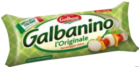
FORMAGGIO GALBANINO GALBANI 270 g