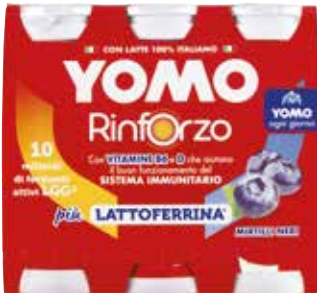
YOGURT RINFORZO YOMO 6x90 g - mirtilli neri, fragola, multifrutti