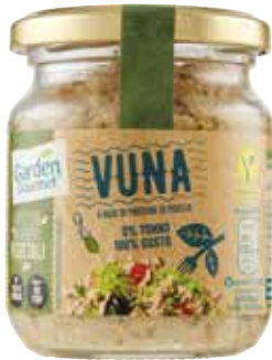
VUNA GARDEN GOURMET 175 g