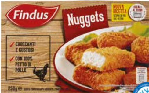
NUGGETS DI POLLO FINDUS 250 g