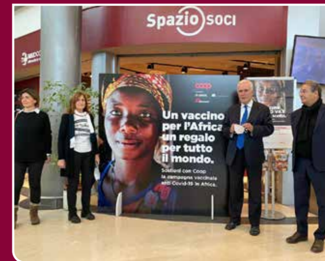
Un momento della presentazione della campagna con il Presidente della Regione Toscana, Eugenio Gianì.

Con la campagna #coopforafrica intendiamo mettere in condizione di accedere alla vaccinazione le persone che vivono in un continente in estrema difficoltà. Un modo per portare avanti la battaglia contro il Covid e cercare di tornare il prima possibile alla normalità pre-pandemia, in tutto il mondo.