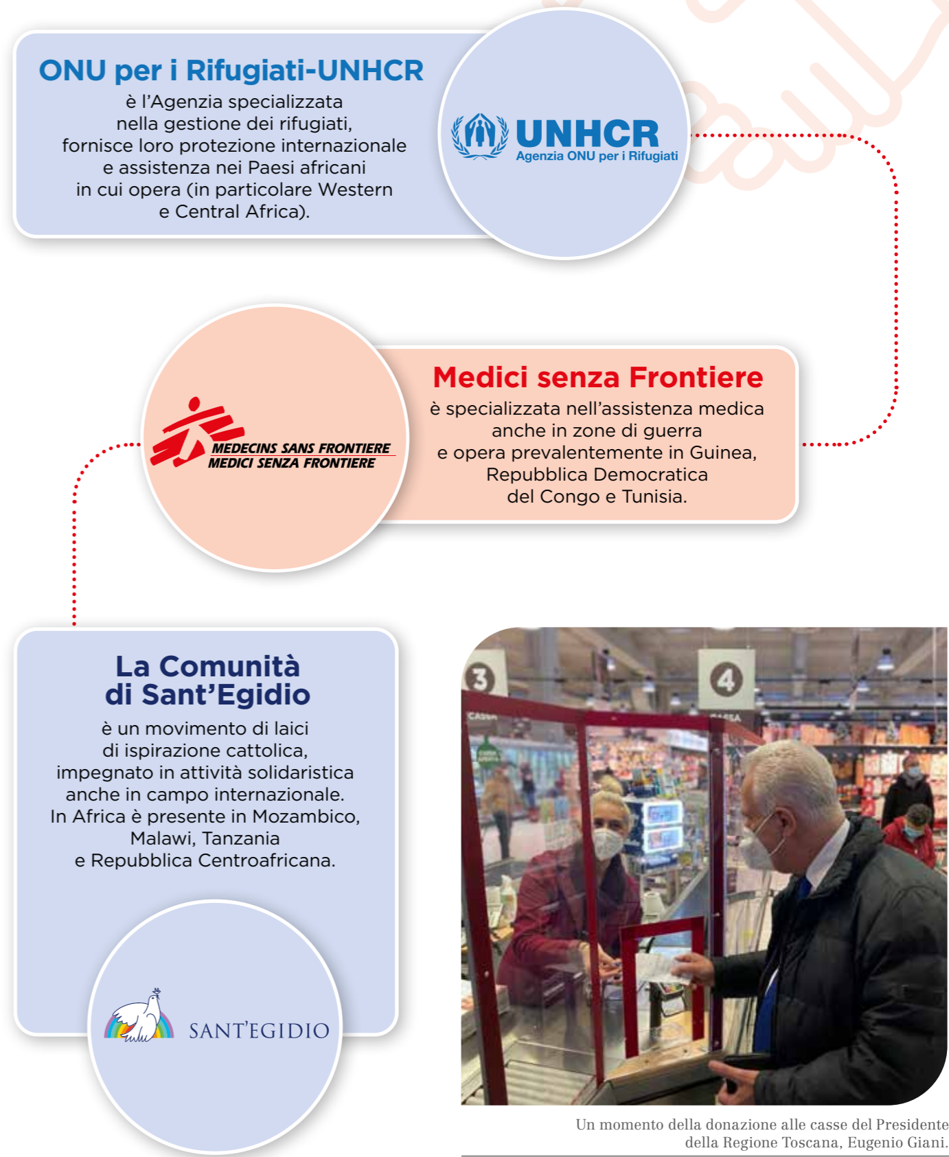
Un momento della donazione alle casse del Presidente della Regione Toscana, Eugenio Gianni.