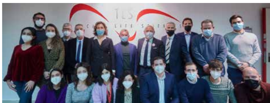
I ricercatori di TLS con i Presidenti delle Cooperative.