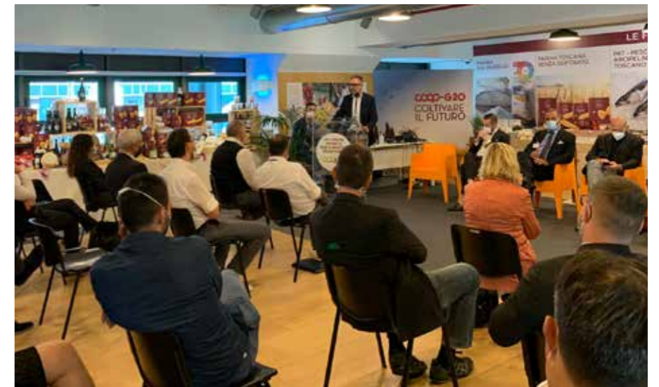
L'incontro con i Direttori e i Business manager della Cooperativa.

N ei giorni scorsi si è tenuto un incontro sul tema delle filiere e del territorio che ha visto la partecipazione di una quarantina tra Direttori e Business manager della Cooperativa. L'incontro è stato l'occasione per approfondire alcuni temi importanti trattati in queste settimane dedicate al G20.