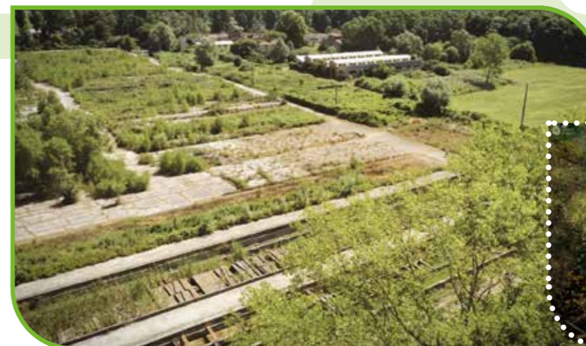
A sinistra l'area destinata al progetto nel suo stato attuale. In basso alcuni rendering che illustrano il progetto.

Il progetto prevede inoltre un percorso naturalistico che si snoda lungo tutto il parco e che raccorda una serie di “luoghi”, come la torre di osservazione, che permetterà una visuale eccezionale della biodiversità locale a otto metri di quota, l'anfiteatro nel bosco e un circuito ad anello con vari tipi di vegetazione, oltre alle vasche dedicate alle piante acquatiche. >>>