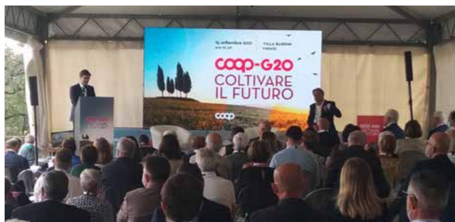
Un momento dell'intervento del Sindaco di Firenze, Dario Nardella.

"Solo attraverso filiere tracciate, trasparenti, rispettose delle persone e del pianeta" - ha detto