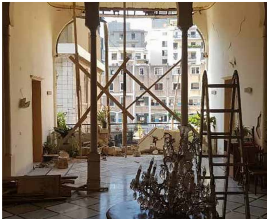
Un terrazzo del convento di San Giuseppe.

La Fondazione inoltre, insieme all'Università di Firenze attraverso lo spin-off DiaCon srl, parteciperà alla fase progettuale del recupero del convento di San Giuseppe , un edificio storico di fine 800 che ha subito gravi danni ed è stato reso inagibile in seguito all'esplosione.