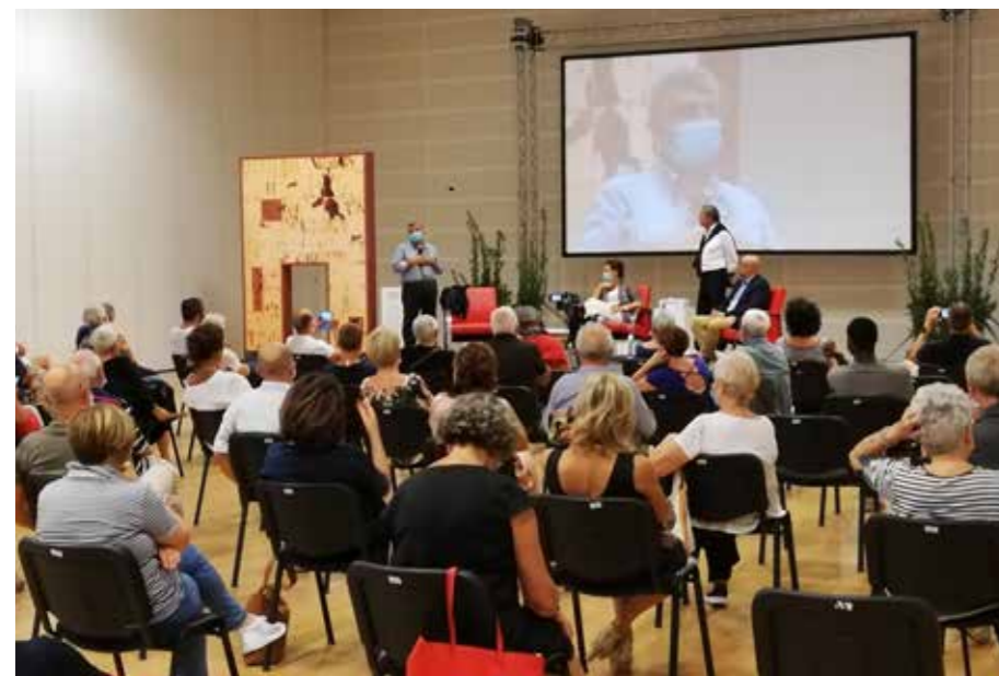
L'incontro per la campagna all'Auditorium Centro Rogers di Scandicci.

Già nei prossimi giorni inizieranno gli interventi di restauro della Porta, che consistono in: pulitura generale di tutta l'opera, sostituzione delle parti metalliche degradate dal tempo, incollaggio delle scaglie di ceramica, stuccatura e consolidamento della struttura.