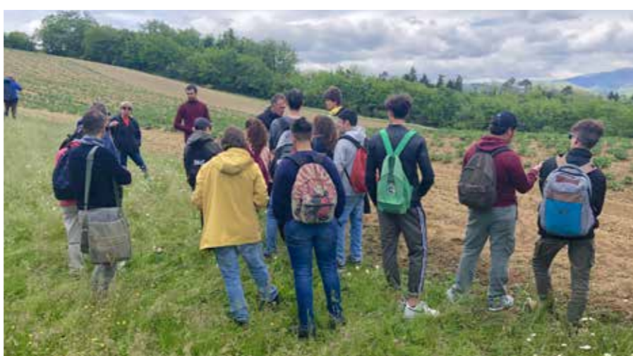
Un'immagine di archivio relativa a un percorso svolto nel 2019.

Il contesto in cui siamo immersi, con le molte sfide da affrontare, ha portato la Cooperativa a organizzare una proposta educativa centrata su temi e valori irrinunciabili , presenti nel proprio piano sociale come: la solidarietà , l' ambiente , il ben-essere e, naturalmente, la cultura .