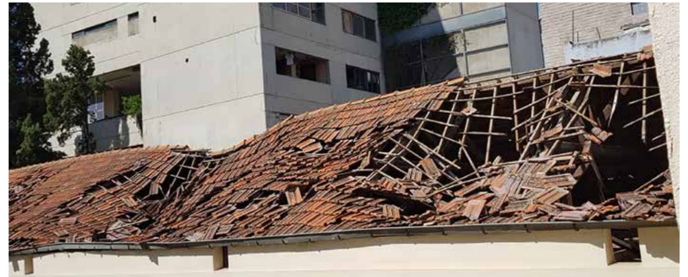
Il tetto del convento di San Giuseppe.