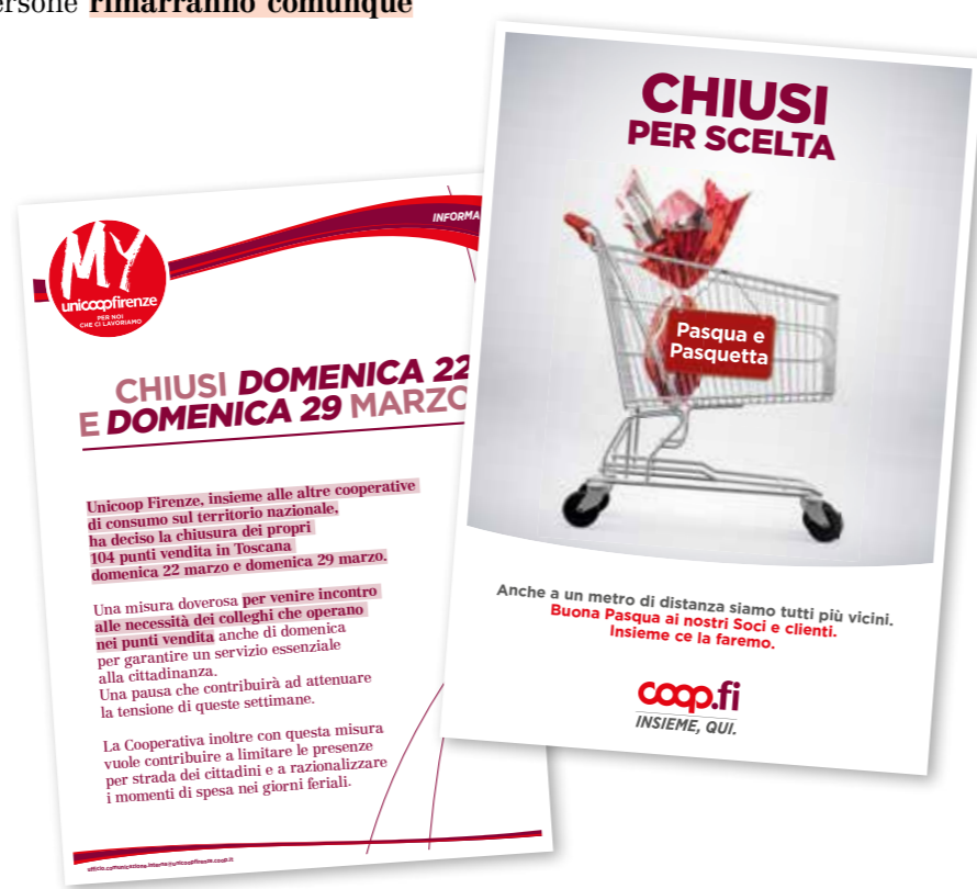
La locandina e la pagina stampa che comunicano ai lavoratori, Soci e clienti le chiusure domenicali.