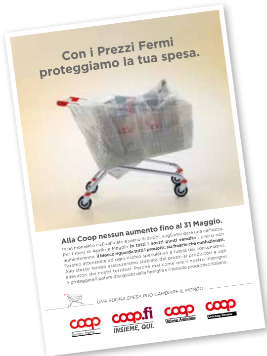
La pagina stampa che annuncia il blocco dei prezzi.

Per questo, per venire anche incontro alle necessità dei lavoratori che operano nei punti vendita e dare loro una pausa che contribuisca ad attenuare la tensione di queste settimane, abbiamo deciso la chiusura dei negozi nelle domeniche e festività che vanno dal 22 marzo al 13 aprile e la riduzione dell'orario di apertura al pubblico, chiudendo alle ore 20.00 tutti i punti vendita. >>>