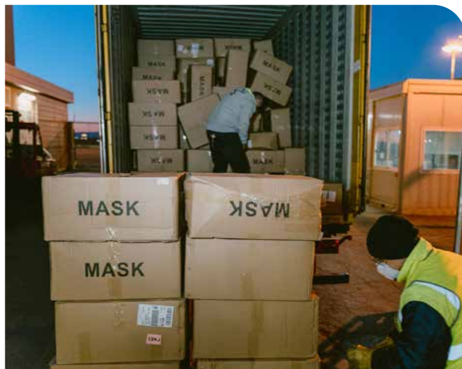
L'arrivo di una parte delle 355.000 mascherine di tipo FFP2 acquistate dalla Cooperativa per il proprio personale.

Aver sviluppato questo patrimonio culturale in tempi ordinari ci ha permesso di reagire prontamente in questa fase emergenziale.