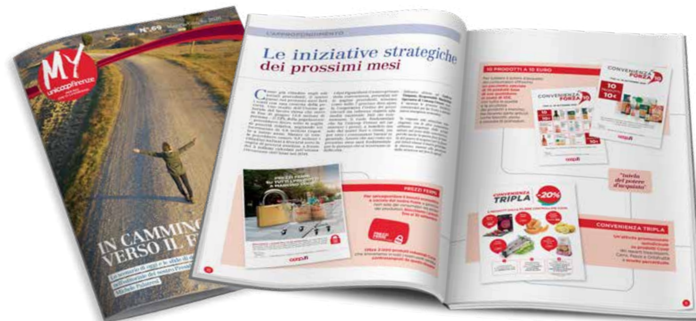
Il precedente numero del MYUnicoop con le iniziative Prezzi Fermi, Convenienza Forza 10 e Convenienza Tripla.