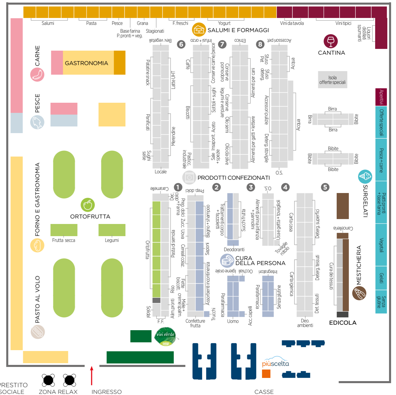
La piantina del negozio all'apertura.

I nostri Soci e clienti troveranno tutte le innovazioni introdotte negli ultimi mesi dalla Cooperativa per tutelare l'ambiente, contro i cambiamenti climatici.