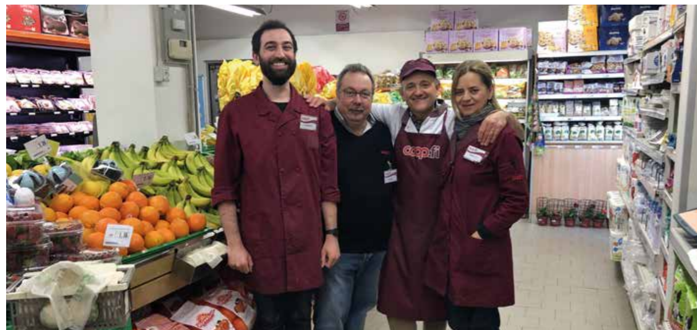
Soddisfazione per il rinnovato punto vendita di Compiobbi.