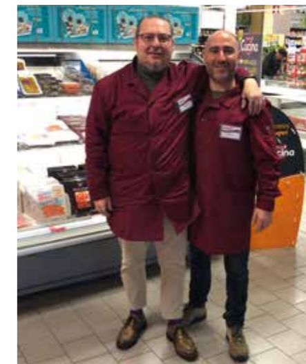
Alcuni momenti della festa di compleanno nel negozio di Empoli Susini.