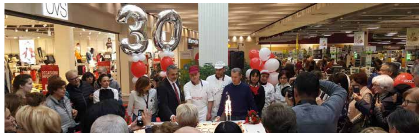
Il punto vendita di Fucecchio ha festeggiato i suoi primi trent'anni.