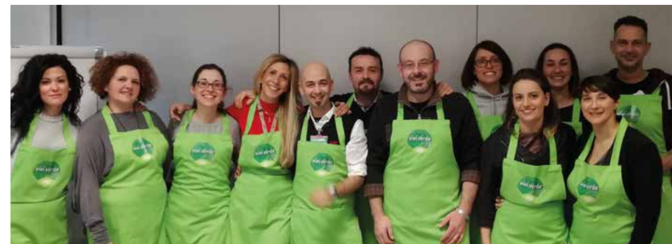
I colleghi che hanno partecipato alla mostra Firenze Bio.