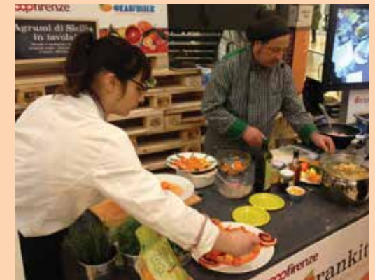
Lo Show Cooking "Orankitchen".