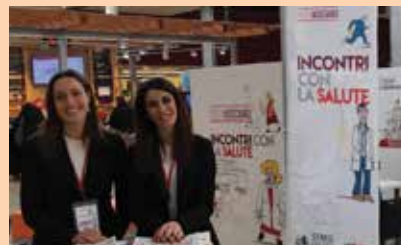
I Medici all'interno delle nostre gallerie commerciali.