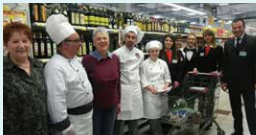
Show cooking al negozio di Agliana

Fino al 30 maggio continua la campagna Coomponiamo iniziata ad aprile. Ringraziamo i tanti lavoratori di Unicoop Firenze che hanno tramandato il loro sapere in cucina.