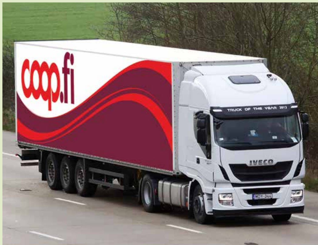
Nuova immagine camion