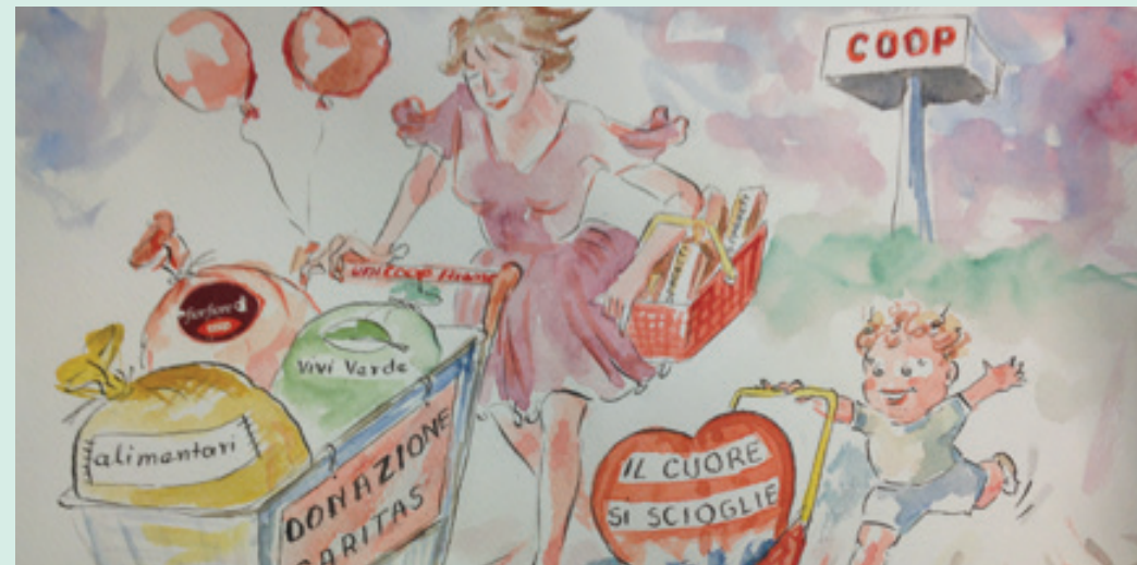
Illustrazione del nostro collega Hamit Hasa del magazzino di Scandicci

A fine marzo sono stati raccolti più di 64.000,00 € .