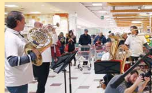
Ort nel negozio di Poggibonsi