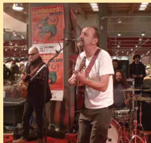
Bandabardò all'interno del pdv di Ponte a Greve

La seconda si esprime attraverso una serie di eventi che sono stati organizzati con le principali associazioni culturali, per promuovere iniziative di forte effetto. La cultura esce dai suoi spazi di rappresentazione e si materializza nei nostri punti vendita.