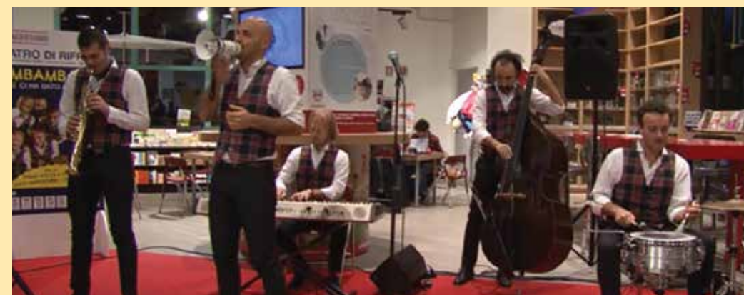
Rimbamband flash mob nel pdv di Novoli