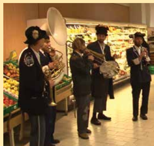
I Musicanti di Brema all'interno del pdv di via Cimabue